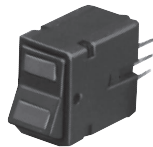
PWB 安装 (有灯型跷板)