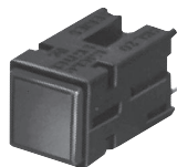
PWB 安装 (一体式柱塞)