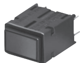
PWB 安装 (标准柱塞)