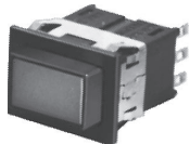
面板安装 (标准柱塞)