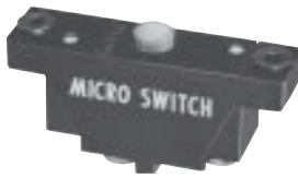
尺寸结构图 图 1