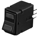
PWB-Befestigung (Beleuchteter Wippschalter)